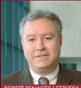
ROBERT BENAGES I CERVERA Alcalde de Cambrils